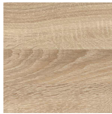
.BE Bardolino Eiche natur